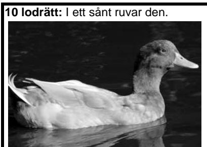
10 lodrätt: I ett sånt ruvar den.