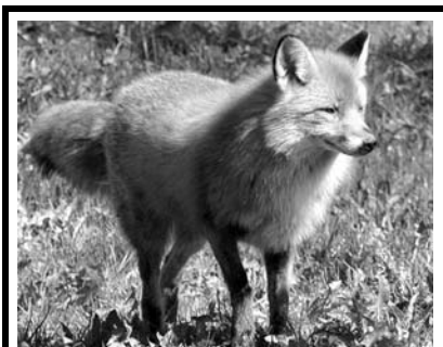
14 lodrätt: Egenskap den sägs ha.