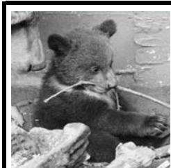
9 lodrätt: Ses den.