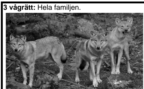
3 vågrätt: Hela familjen.