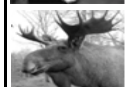
8 vågrätt: Är de alla.