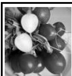
5 vågrätt: I ental.