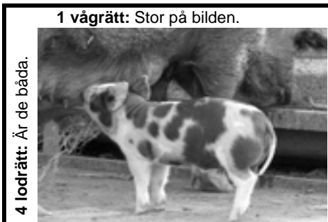
1 vågrätt: Stor på bilden.