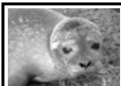
7 vågrätt: Sälunge.