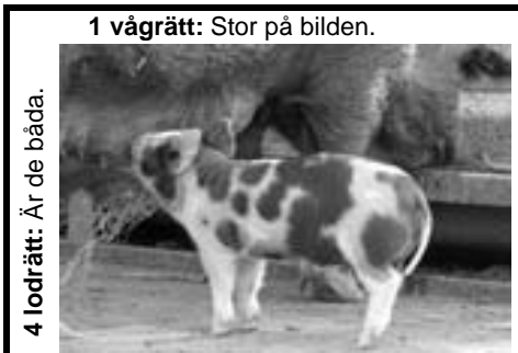
1 vågrätt: Stor på bilden.