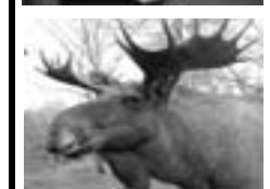
8 vågrätt: Är de alla.