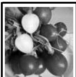
5 vågrätt: I ental.