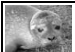
7 vågrätt: Sälunge.