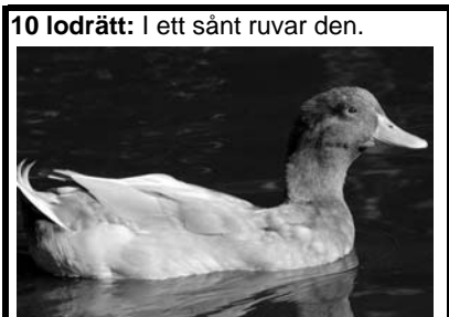
10 lodrätt: I ett sånt ruvar den.