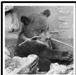
9 lodrätt: Ses den.